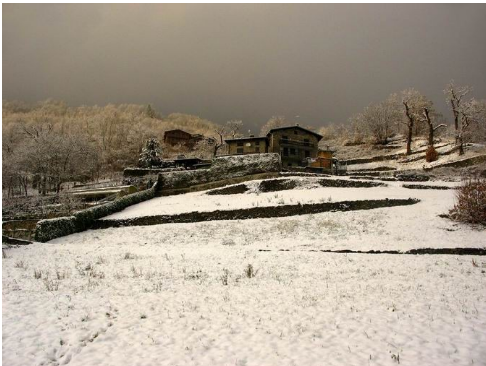
Cà Benedetti (767 m) sotto un cielo minaccioso.