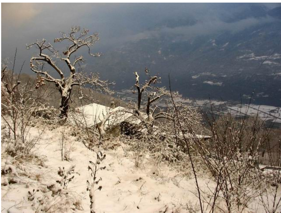
Cà Bongiascia (893 m, Montagna). A destra, si intravede la poca neve sopravvissuta nel fondovalle, mentre resiste bene oltre i 500 metri sulle Orobie.