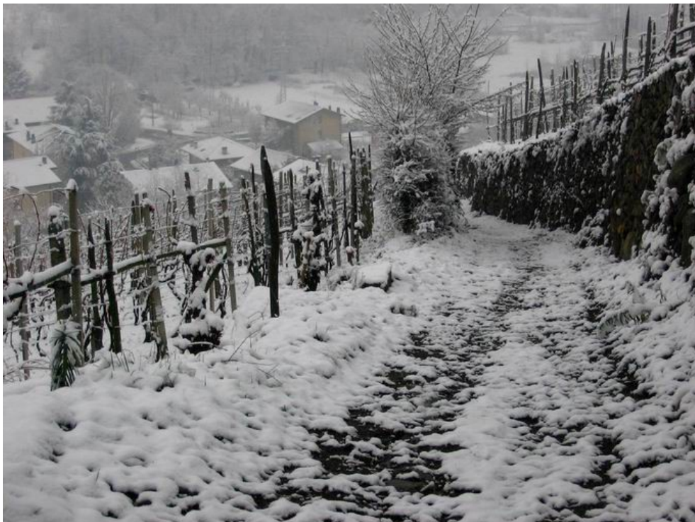
Una mulattiera che taglia i vigneti a Montagna.

Sempre di venerdì, di nuovo il 26 gennaio. Questa volta, però, siamo ben lontani dai quasi 40 cm caduti un anno fa. Nell'inverno dei record, il più caldo degli ultimi 2 secoli, l'unica nevicata valtelinesa rappresenta quasi un'eccezionalità. Seguono alcune foto scattate a Montagna e nelle più alte contrade. In paese, l'accumulo finale ha raggiunto appena i 5 cm.