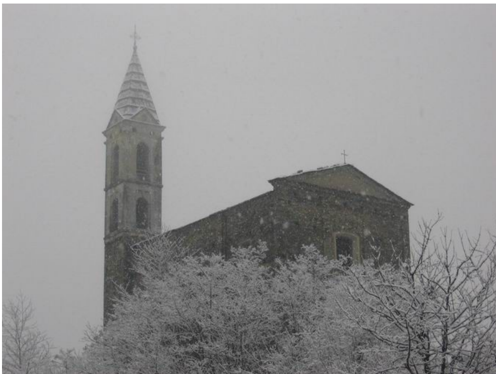
La chiesa di S. Antonio a Montagna nel momento clou della nevicata.

Sempre di venerdì, di nuovo il 26 gennaio. Questa volta, però, siamo ben lontani dai quasi 40 cm caduti un anno fa. Nell'inverno dei record, il più caldo degli ultimi 2 secoli, l'unica nevicata valtelinesa rappresenta quasi un'eccezionalità. Seguono alcune foto scattate a Montagna e nelle più alte contrade. In paese, l'accumulo finale ha raggiunto appena i 5 cm.