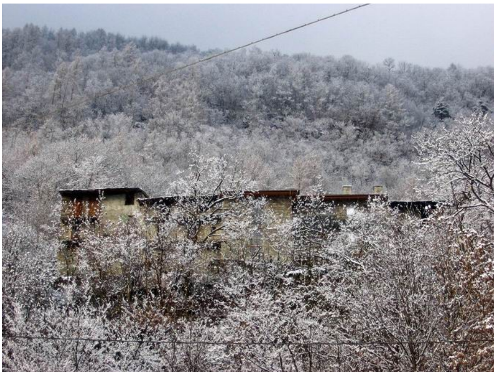
Cà Credaro (668 m) nel primo pomeriggio.